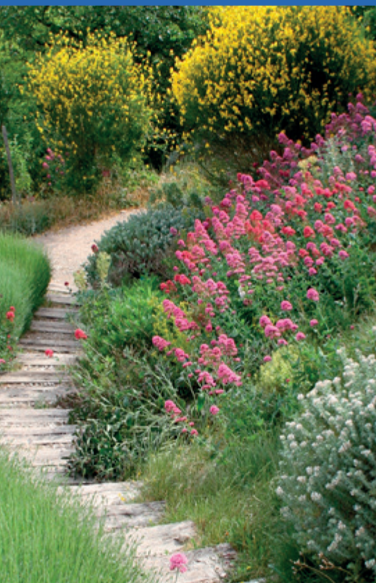
Jardin botanique de Gigondas